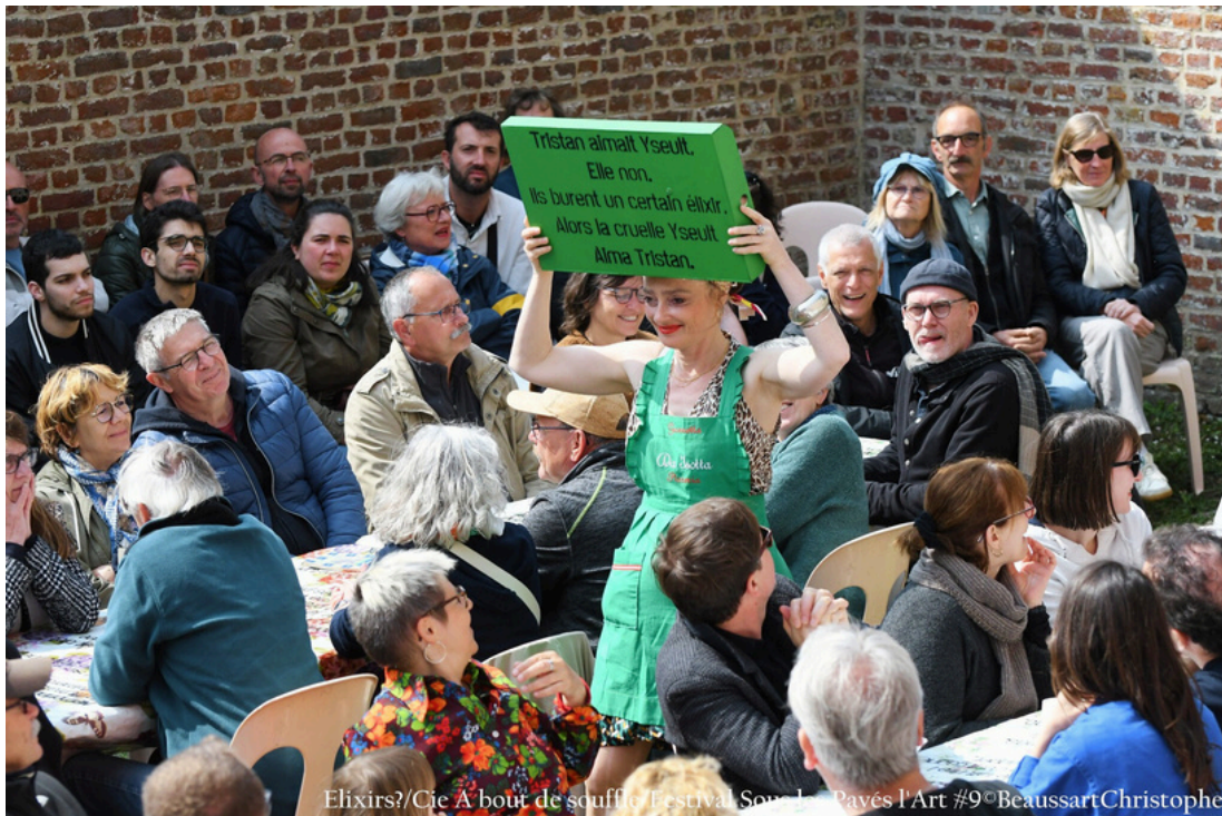
Elixirs?/Cie A bout de souffle Festival Son J. Pavés l'Art #9° BeaussartChristophe